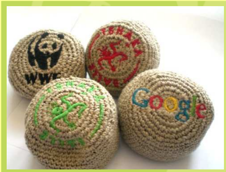
Tshaka balles en chanvre bio